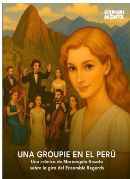
Image générée par IA.

Ces images offrent un contrepoint visuel