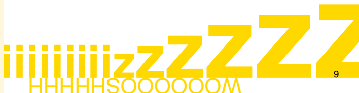
Plate-forme de recherche sur les nouvelles interfaces de contrôle et d'écriture pour la création artistique et les industries culturelles.