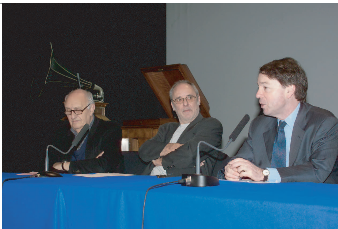
Jean-Noël Jeanneney, Maxime Le Forestier et Pierre Tchernia ouvrent la première Semaine du Son