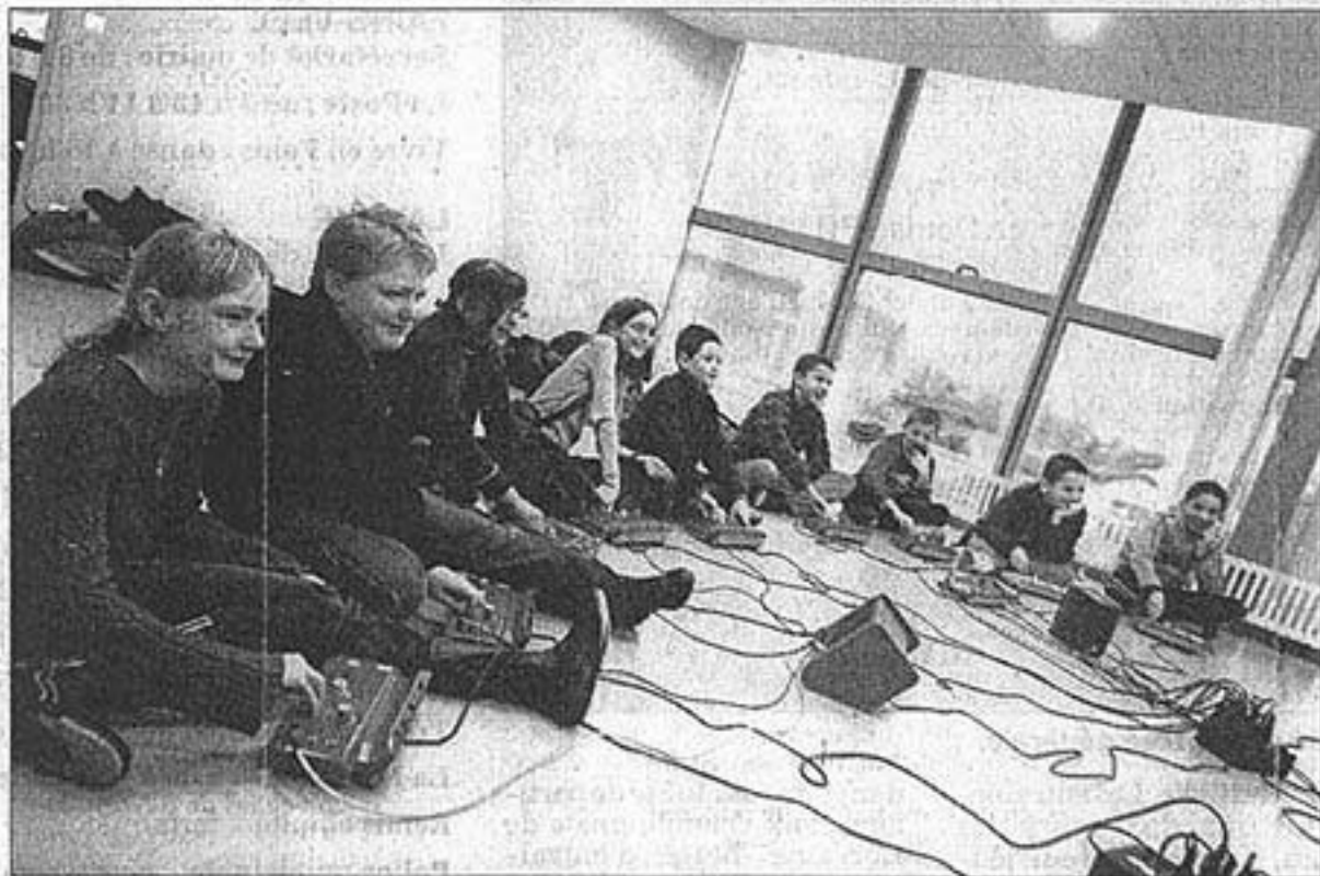
Les petites boîtes qui font du bruit mettent les écoliers en joie